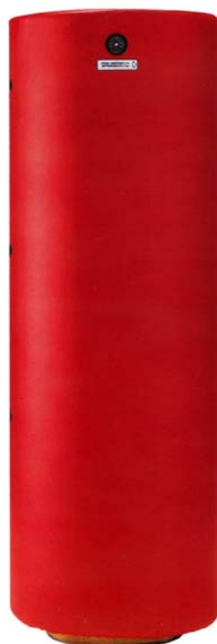
visione di un bollitore a 300 litri modulare